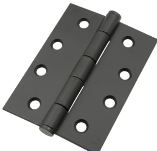
NOVAS 诺万五金制造（上海）有限公司 家具五金

因为铜质轴承合页式样美观、亮丽，价格适中，并配备螺钉。其他合页：有玻璃合页、台面合页、翻门合页。玻璃合页用于安装无框玻璃橱门上，要求玻璃厚度不大于5、6毫米。铰链是用来连接两个固体并允许两者之间做相对转动的机械装置。铰链可能由可移动的组件构成，或者由可折叠的材料构成。合页主要安装于门窗上，而铰链更多安装于橱柜上，按材质分类主要分为，不锈钢铰链和铁铰链；为了让人们得到更好的享受又出现了液压铰链（又称阻尼铰链）。诺万五金不仅擅长于不锈钢建筑门五金产品类的制造，且在不锈钢五金产品的设计、加工工艺上有其独到之处。